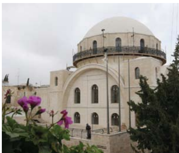
בית-כנסת "החורבה" בבנינו.