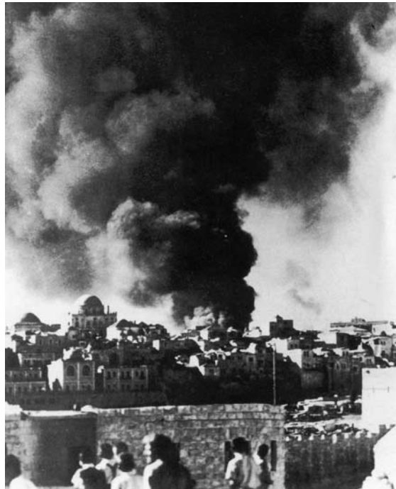
פיצוץ רחוב בן יהודה, לפני - בתי הכנסת ברובע היהודי, פברואר 1948

את הנברשות עדיין לא הרכיבו ולכן אני לא יכולה להשוות אותן למה שאני זוכרת מילדותי. מה שאני זוכרת מילדותי זה ציורים רבים של בעלי חיים המתארים את המשנה "הוי עז כנמר וקל כנשר ורץ כצבי וגבור כארי לעשות רצון אביך שבשמים". היו עוד ציורים על הקירות. הכיפה היתה צבועה מבפנים בכחול כמו השמים, עם כוכבים. המבוגרים שרצו לצחוק על